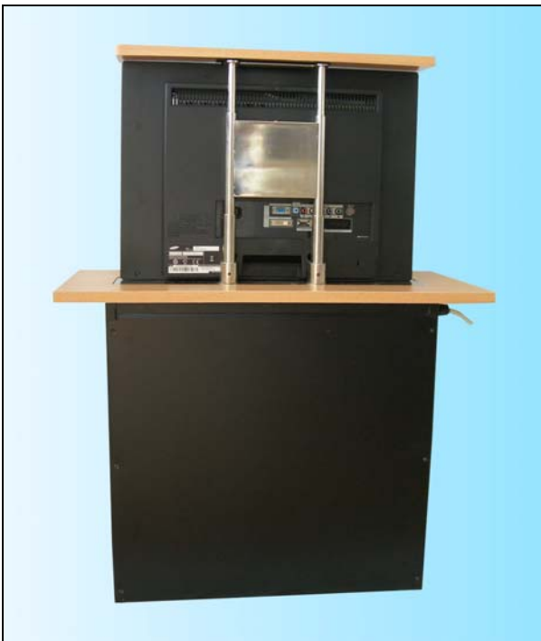
Vista posteriore elevatore aperto