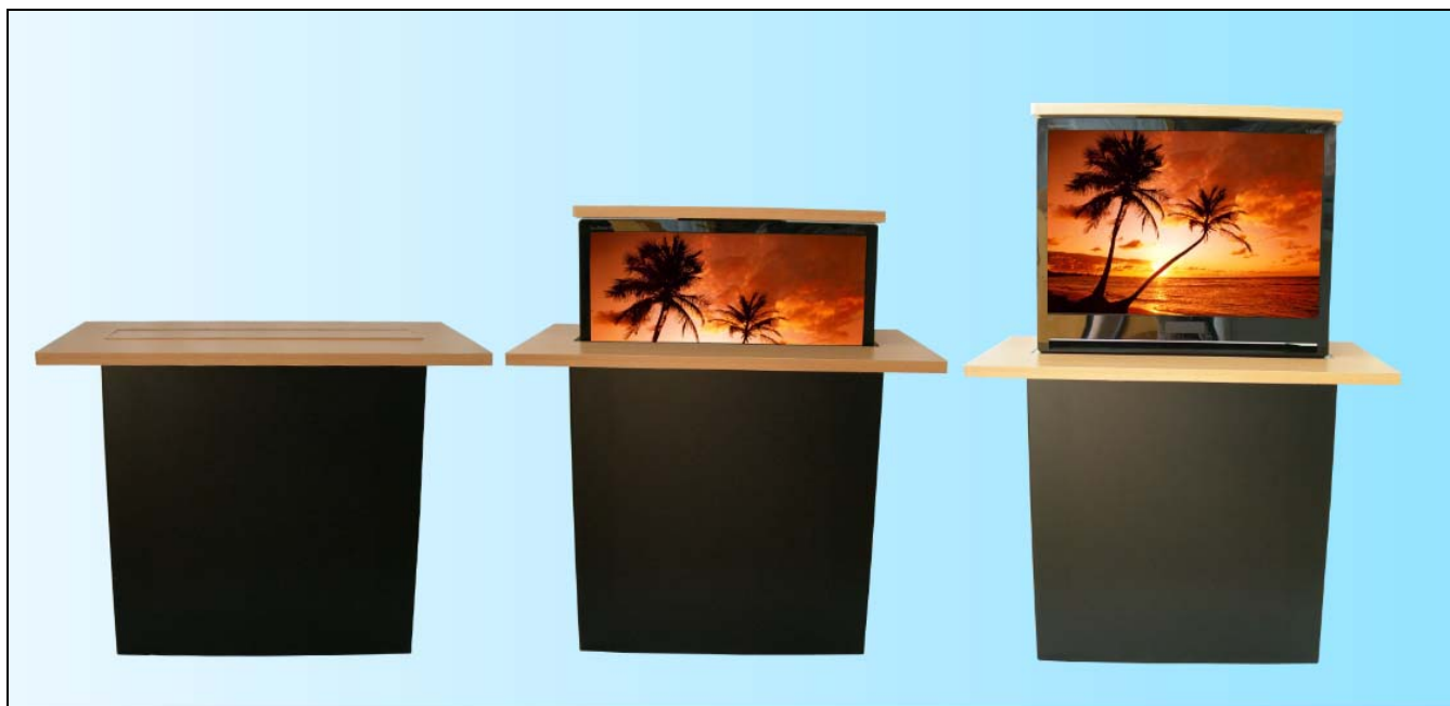
ELEVATORE PER MONITOR IN POSIZIONE CHIUSA E APERTA

L'elevatore per monitor modello MX22 è un prodotto versatile e innovativo. I nostri elevatori offrono una soluzione professionale per nascondere e far apparire i monitor a pannello piatto dalla misura di 15" a quella di 22" (in diagonale).