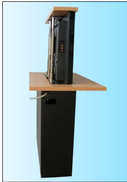
Vista laterale elevatore aperto